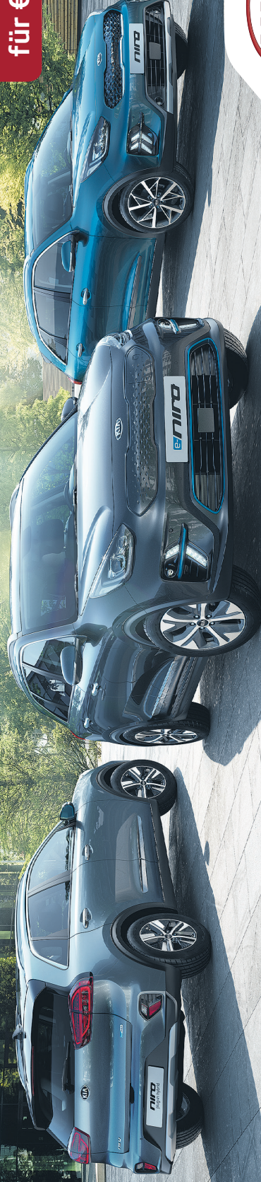
Abbildung zeigt kostenpflichtige Sonderausstattungen